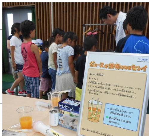
●実験の様子(2016年開催時)