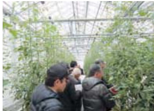
太陽光型植物工場視察風景