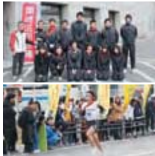
岡崎市民駅伝競走大会

地域とのつながりを深めるために、地域が主催するさまざまなイベントに役職員が積極的に参加しています。