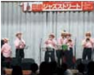
岡崎ジャズストリート