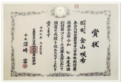
▲全国剣詩舞コンクール決勝大会 剣舞 少年の部 優勝

苦労ではないのですが、膝を痛めて練習できなかつた時期は辛かったです。全国大会まであと一歩及ばず悔し涙を流したこともありました。でもその辛さや悔しさを糧に稽古に励むことができたと思っています。