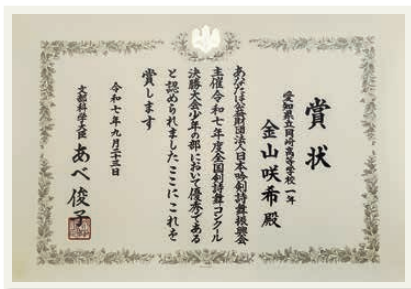
▲全国剣詩舞コンクール決勝大会 文部科学大臣賞