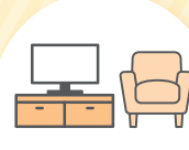
インテリア・ 家電

その他さまざまな用途 にご利用いただけます。 ※事業性資金、投機的な 資金にはご利用いただ けません。