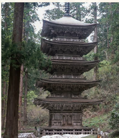
はぐろさん ごじゅうのとう 羽黒山 五重塔

羽黒山の杉並木が続く2446段の石段や森の中に静かに佇む国宝 羽黒山五重塔は、厳かな空気が漂います。今年も十二年に一度の御縁年にあたる特別な年とされ、この年に参拝すると何倍もの御神徳や十二年分の御利益を得られると信じられています。