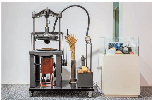
▲麦わら帽子製造用水圧機

国産ミシンの実現につながる「麦わら帽子製造用水圧機」をはじめ、ブラザー初のミシンや家電、オートバイ、タイプライターなど、これまでの代表的な製品を展示しています。