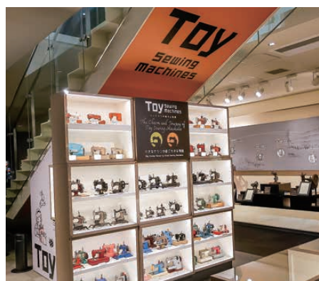
▲トイミシンの展示コーナー