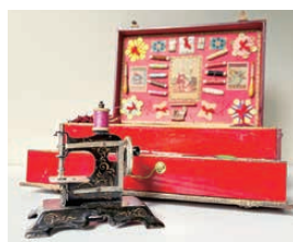
▲トイミシンとソーイングセット

1950年代にブラザーが製造していたトイミシン「Baby Brother」や、海外製のトイミシンなど約70台のほか、ソーイングセットなどをご覧いただけます。