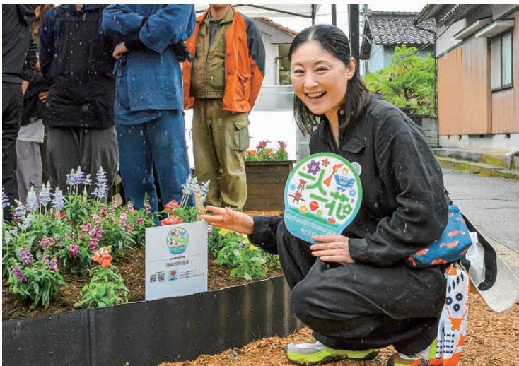
アンバサダーの俳優 常盤貴子氏

5月1日(金)に開催されたガーデン花植えイベントに参加し、アンバサダーの俳優 常盤貴子氏が地域の皆さまとともに当金庫協賛ガーデンへの花植えを行いました。