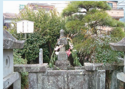
源応尼の墓／華陽院（静岡市）

駿府人質時代の多感な8歳から19歳の家康公を、親代わりとなって扶育したのは母・於大の母の源応尼です。家康公の祖母にあたる女性で、刈谷城主 水野忠政の妻となり、その後、その美貌のため、松平清康(家康公の祖父)が水野家との講和の条件として後妻にしたといわれます。源応尼は竹千代(家康公の幼名)の駿府での寓居近くにある智源院(後、華陽院に改称)の庵に住み、細やかな愛情を注いだと伝わりますが、19歳となった家康公が「桶狭間の戦い」に出陣する直前に70余歳の生涯を閉じています。