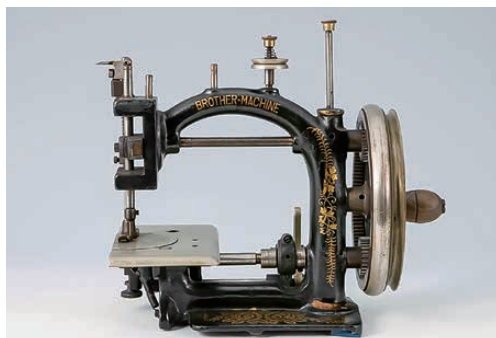
▲麦わら帽子製造用環縫ミシン「昭三式ミシン」(1928年)