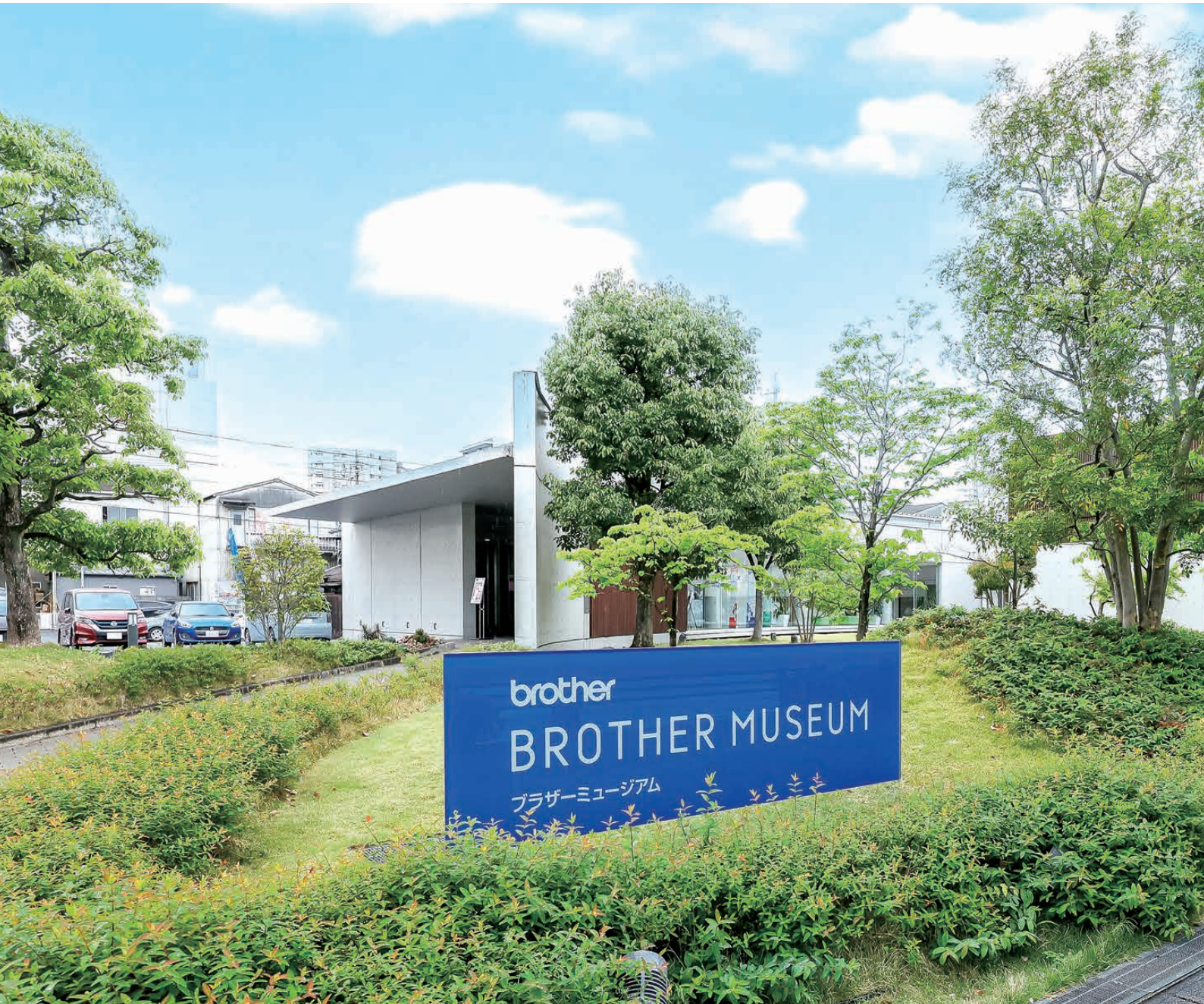
ブラザーミュージアム（名古屋市瑞穂区）