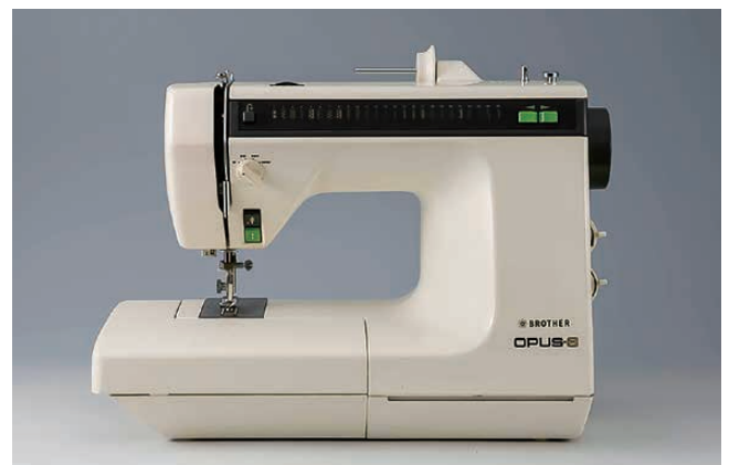
▲家庭用コンピューターミシン「オーパス8」(1979年)

創業者兄弟がミシン国産化への足掛かりとして製作したのが、この麦わら帽子製造用水圧機でした。この水圧機は、70年以上の間、名古屋市内の帽子製造工場で使われていました。