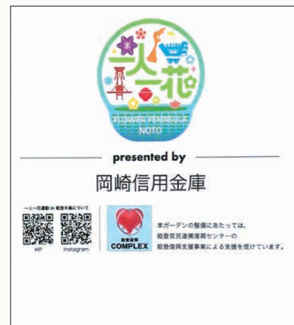
協賛企業プレート