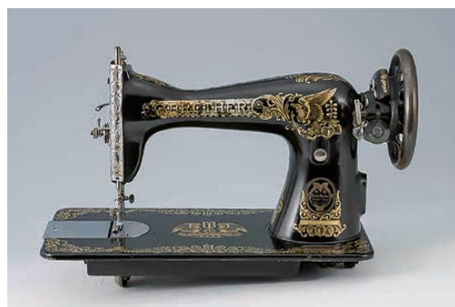
▲ブラザー初の家庭用ミシン「15種70型」(1932年)

1800年代に作られた世界の歴史的なミシンやブラザーの代表的なミシンを展示しています。ミシンの歴史や仕組みに加えて、ブラザーが開発した技術、工場での製造工程についても学んでいただけます。また、ミシンが作り出す刺しゅう作品もご覧いただくことができます。