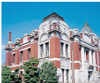
岡崎信用金庫資料館